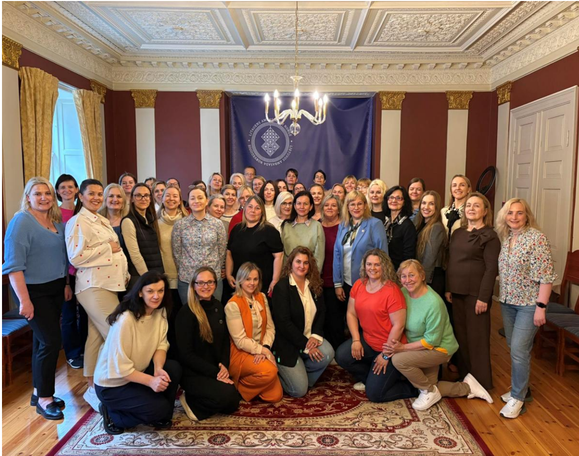
Oslas, 2025 gegužę