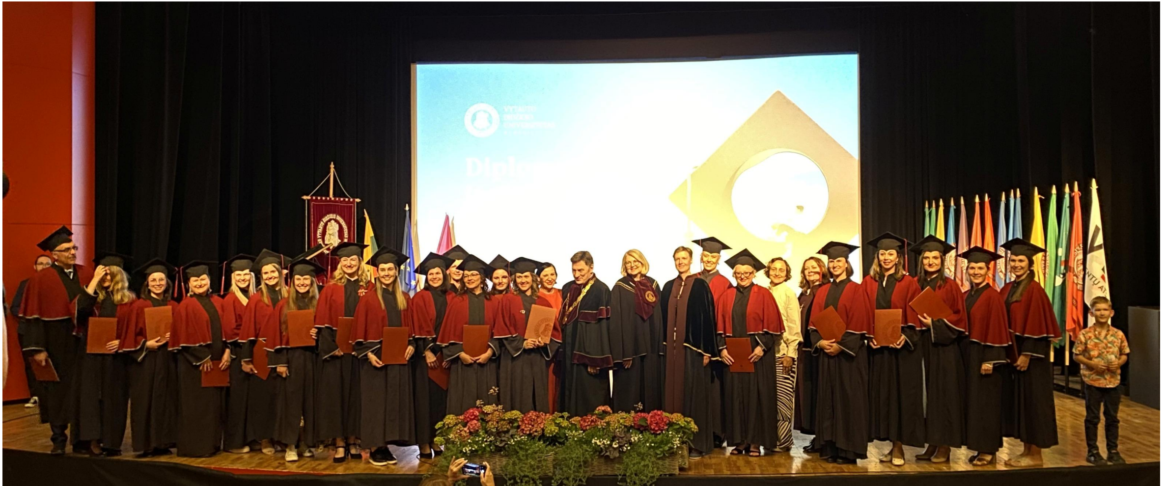
Pedagogikos absolventai.