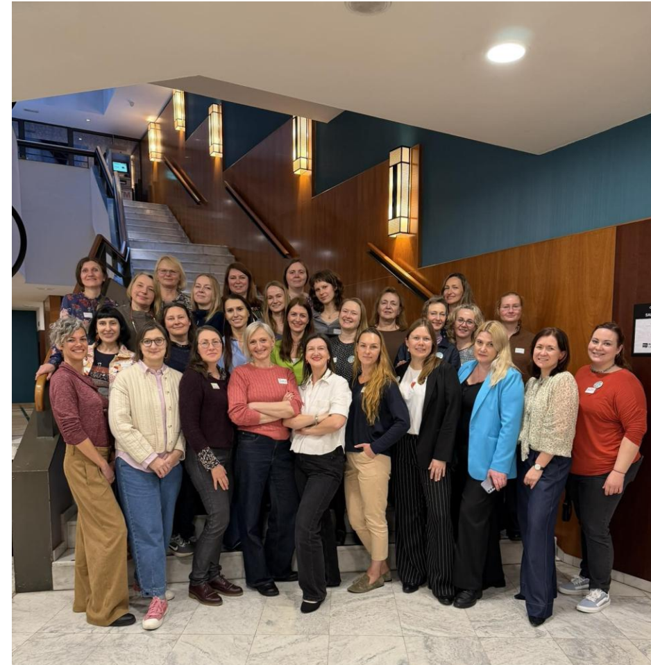
Barselona, 2026 kovas